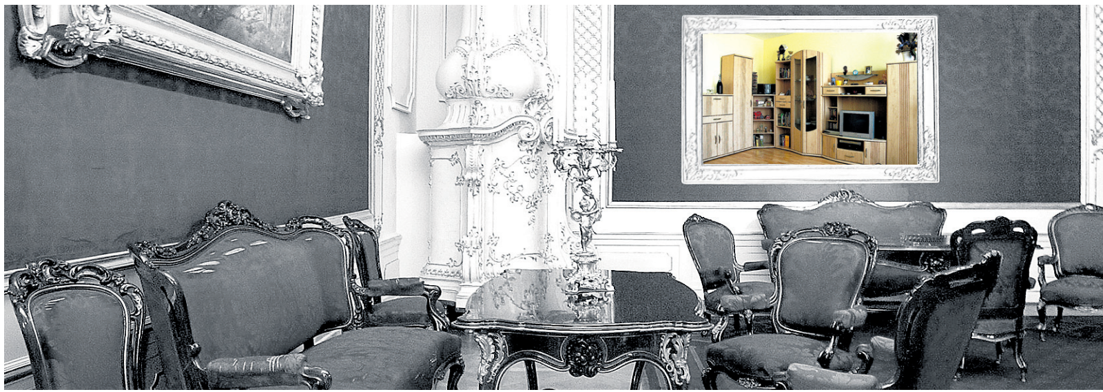
Jedem seine Lieblingsmöbel: das Wohnzimmer von Kaiser Franz Joseph I. im Sisi-Museum, im Bild der Wandverbau von Österreichs Durchschnittsfamilie. Noch immer wird sehr statisch eingerichtet, der Trend zur ständigen Veränderung setzt sich nur langsam durch.

WOHNTRENDS. Die heimischen Wohnzimmer erweisen sich als recht veränderungsresistent.